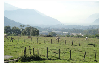
Sillon Alpin : Voironnais