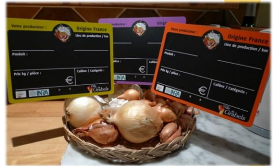
Ci-dessus : étiquettes/piques-prix mis en place sur le marché de Grabels

Permettre aux consommateurs de choisir et à tous de suivre les engagements : le système d'étiquetage suppose que les exposants soient transparents par rapport à l'origine de leurs produits. La signalisation de l'origine donne alors aux consommateurs la possibilité de faire des choix au moment de leur achat, selon ce qu'ils souhaitent privilégier. Dans le même temps, elle facilite le suivi des engagements par le comité consultatif, mais aussi par les clients et autres exposants.