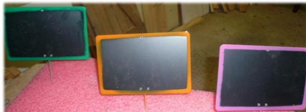
Premières étiquettes artisanales du marché de Grabels

Ce marché en circuits courts a aussi été construit en concertation avec les commerçants du village, qui peuvent venir y proposer leurs produits. La décision de proposer le marché le samedi est notamment une façon de ne pas gêner les commerces de détail qui réalisent une partie importante de leurs chiffres d'affaires le dimanche.