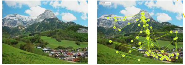
Figure n°3 : Approche cognitive par oculométrie