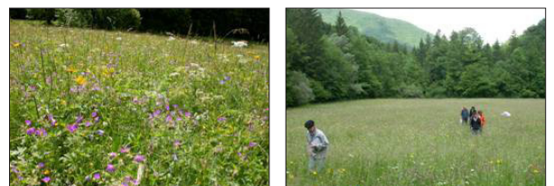
Figure n°6 : Photos concours Prairies fleuries, PNR des Bauges (2008)

♦ En l'absence d'une telle structure, les acteurs publics apparaissent surreprésentés dans les dispositifs dédiés à l'environnement, ceux-ci ne constituant guère le cadre de collaborations effectives. Ils se caractérisent en effet par la faible densité et réciprocité des collaborations. Ceci tient probablement à la rareté des initiatives prises pour valoriser les aménités, ou tout du moins à leur manque de visibilité. De ce fait, on peut se poser la question de l'efficacité de ces réseaux d'acteurs, en termes de développement économique.