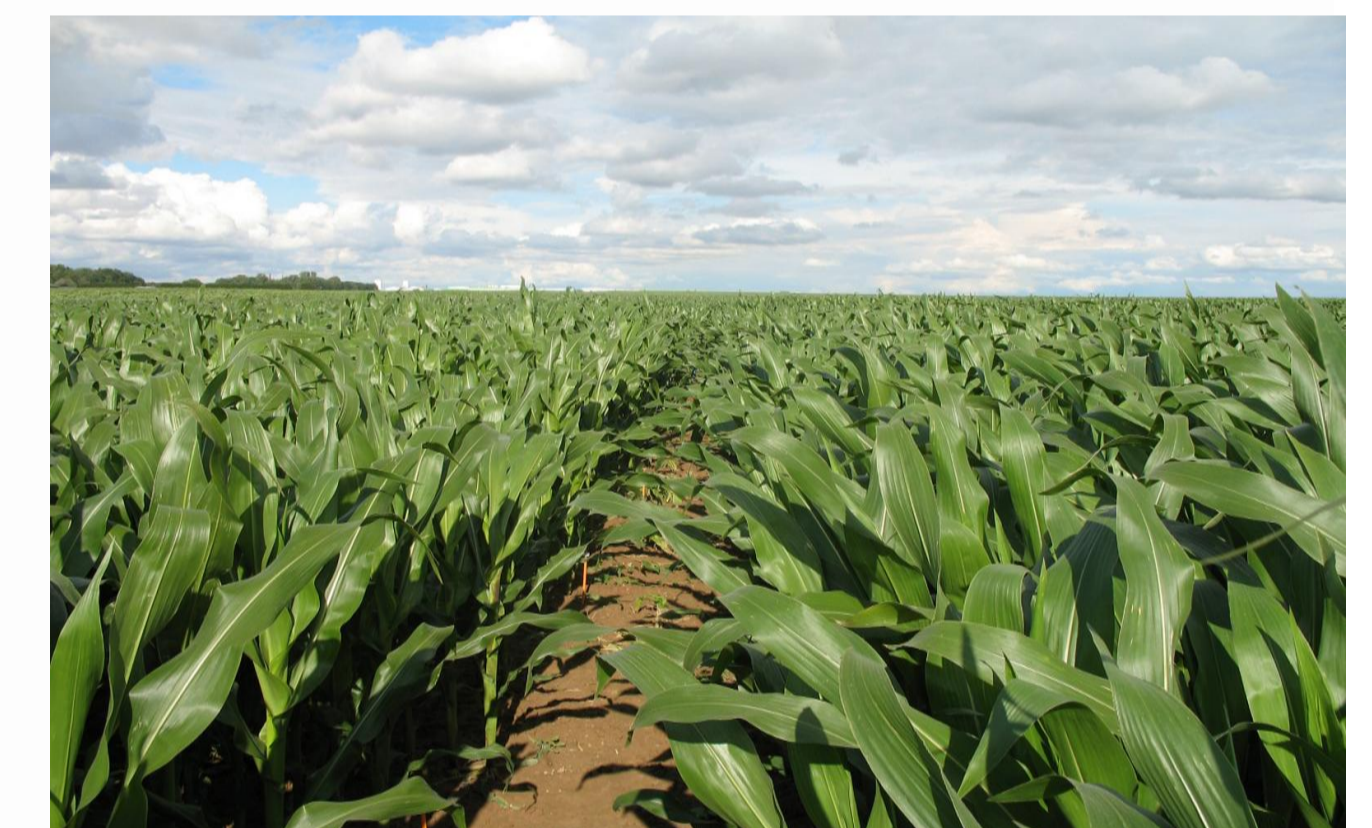
Lauragais – Midi-Pyrénées

L'atelier de représentation spatialisée des enjeux territorialisés a permis de valider les scénarios et de localiser les zones critiques (/enjeux productifs, environnementaux et d'aménagement). L'identification de ces zones avec les acteurs permettra de mieux concentrer et cibler à l'avenir les efforts de recherche, de développement et d'investissement.