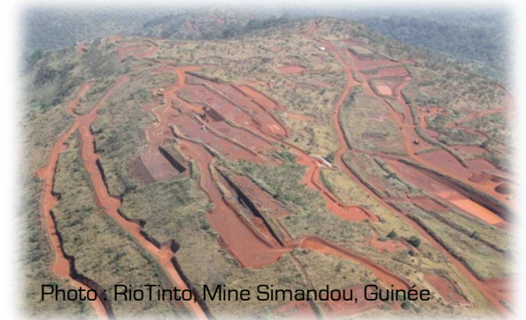
Mine Simandou, Guinée