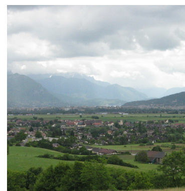
Montagnes, espaces agricoles et urbanisation - Région urbaine annecienne