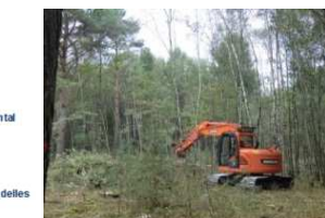
Sylvoécocorégions du Centre Val de Loire